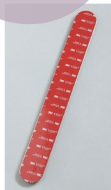
Element med 3M-tejp, utan fäste.