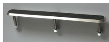
Element för skrapgaller, med svart inlägg.