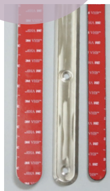
Element med 3M-tejp och element för fäste med skruv där inlägget döljer skruvskallarna.