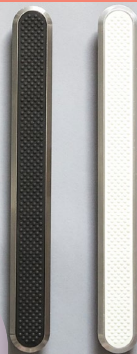
Rustfri elementer med sort og hvidt indlæg. Fås også med selvhæftende tape.