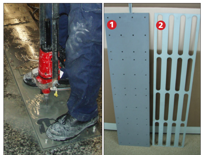
Skabeloner til placering af elementer og nitter letter og sikrer installationen.