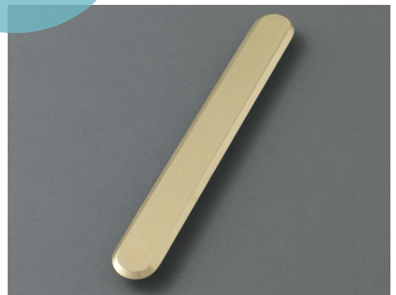
Element Matt Line.

Matting taktila ledstråk Mässing produceras genom gjutning. De installeras efter ett angivet intervall för att vägleda personer med synnedsättning. Installationen sker genom borrar av hål i underlaget, tre hål per element samt ett hål per nit. En mall för hålen placering används. Man fixerar fästena med rekommenderat lim som appliceras i de borrade hålen. Element och nitar kan även beställas utan fäste för limning.